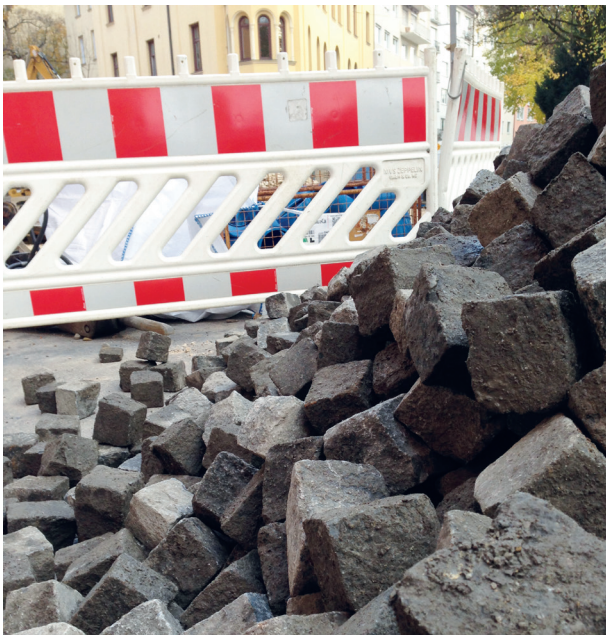
Baustelle für Container für Google-Arbeiter in der Deroystraße

Kontaktdaten und aktuelle Themen findet Ihr unter www.beamte.verdi.de .