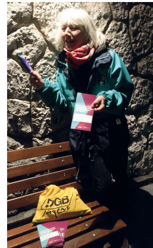
Bilder von links nach rechts: bundesweite Verteilaktion am 28.09.2022

An dieser Entwicklung haben die Gewerkschaften entscheidenden Anteil.