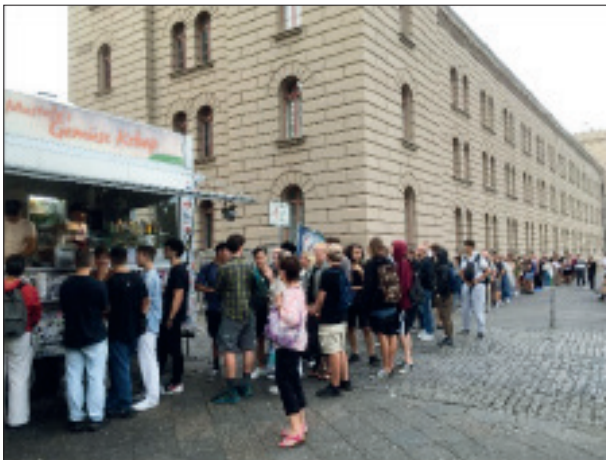
Essen wärmt bekanntlich auch! Hier vor dem Finanzamt Friedrichshain-Kreuzberg