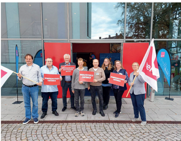
ver.di Aktion zur Umverteilung

Das „Auswürfeln“ der Besoldung muss ein Ende haben. Beamtinnen und Beamten fordern eine bessere Einbindung und mehr Einfluss bei der Gestaltung ihrer Arbeitsbedingungen mitsamt der Bezahlung. Mach doch mit bei ver.di - dann sind wir stärker als je zuvor!