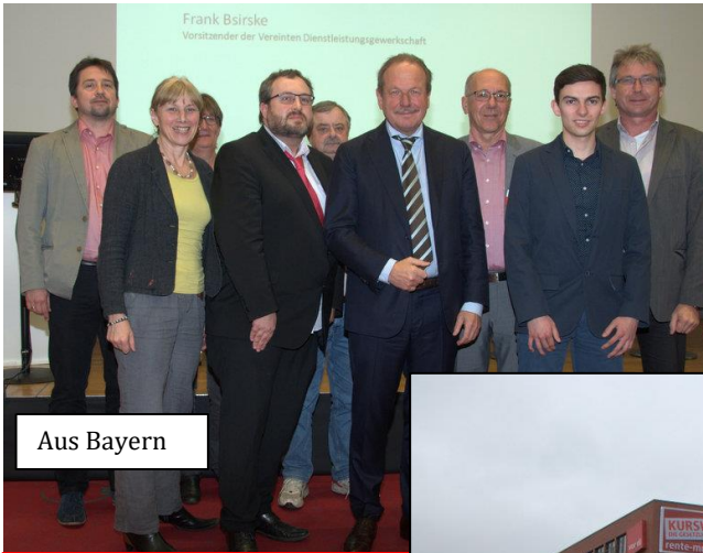
Frank Bsirske Vorstandsvorsitzender der Vereinigten Dienstleistungsgewerkschaft