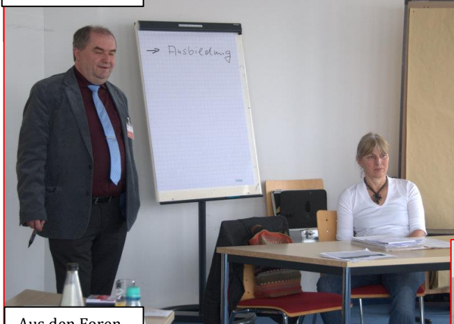
Aus den Foren