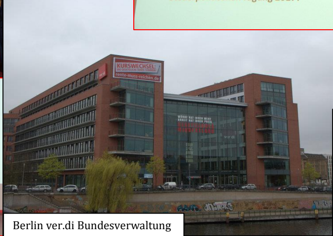
Berlin ver.di Bundesverwaltung