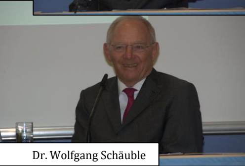
Dr. Wolfgang Schäuble