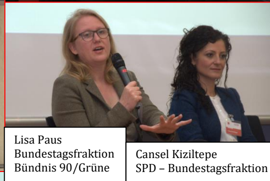
Lisa Paus Bundestagsfraktion Bündnis 90/Grüne Cansel Kiziltepe SPD - Bundestagsfraktion